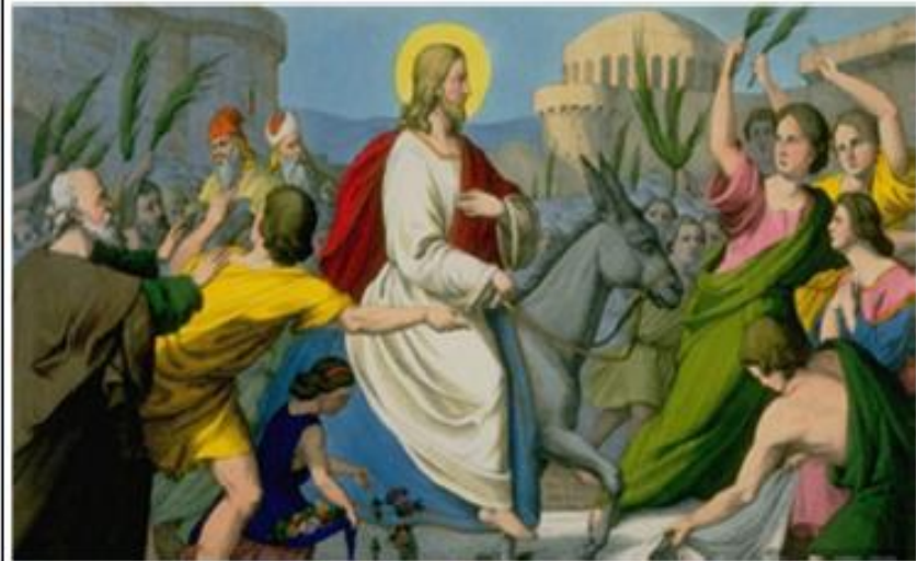
Φτάνει ο Χριστός στην Ιερουσαλήμ