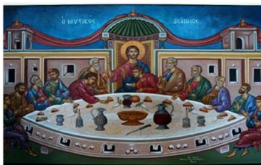
Ο Μυστικός Δείπνος