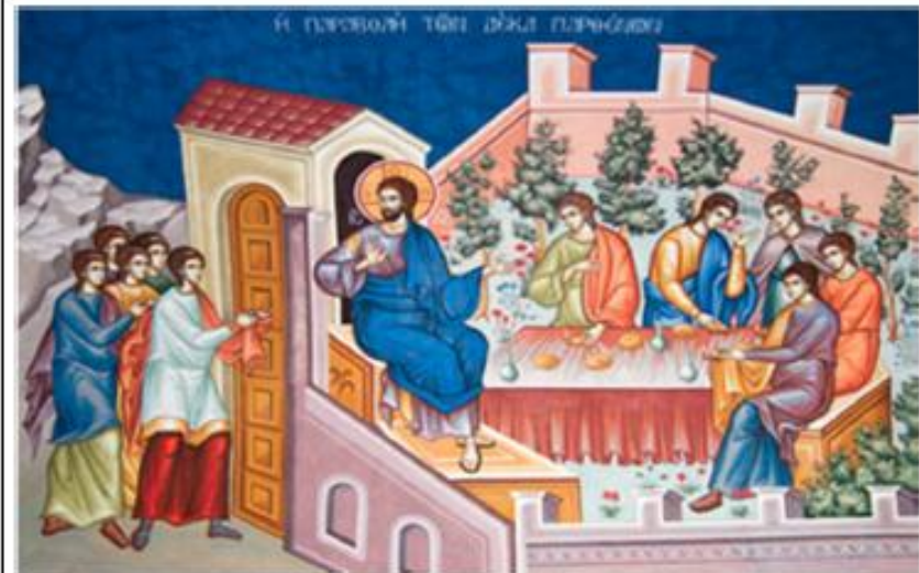
Η Παραβολή των 10 Παρθένων