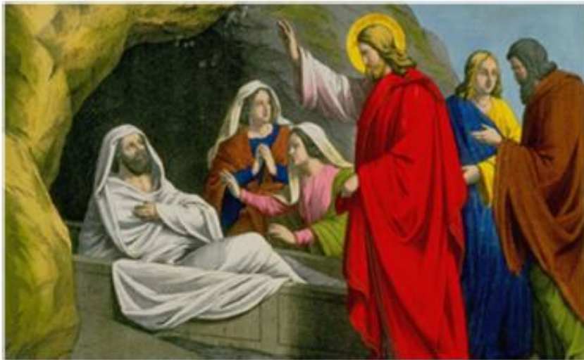
Ο Χριστός ανασταίνει τον Λάζαρο