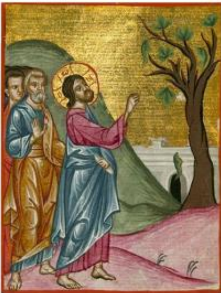
Ο Χριστός ξεραίνει τη συκιά