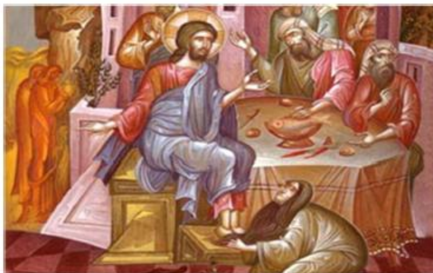
Η Μαρία η Μαγδαληνή πλένει τα πόδια του Χριστού