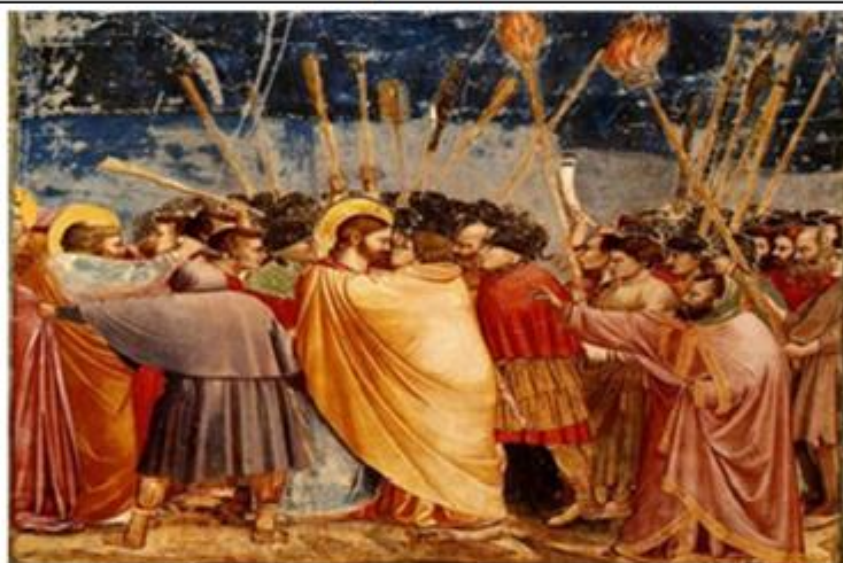
Η προδοσία του Ιούδα